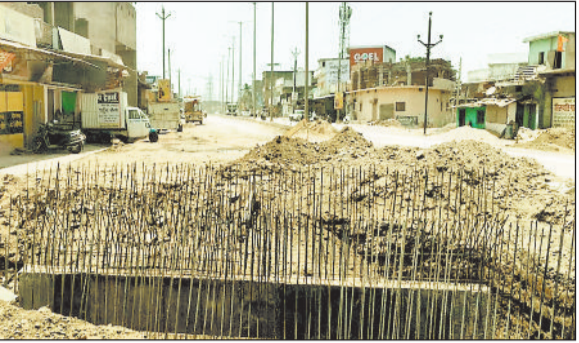
हरिभूमि न्यूज चंद्रपुर

नगर पंचायत चंद्रपुर के यादव मोहल्ले में नाली पर बन रहा मिनी पुल इन दिनों लोगों के लिए परेशानी का कारण बन गया है। कई महीनों से निर्माण कार्य अधूरा पड़ा है और बीते दो महीनों में काम की रफ्तार लगभग थम सी गई है। आधा बना पुल और आधा अधूरा हिस्सा अब लोगों की रोजमर्रा की जिंदगी को प्रभावित कर