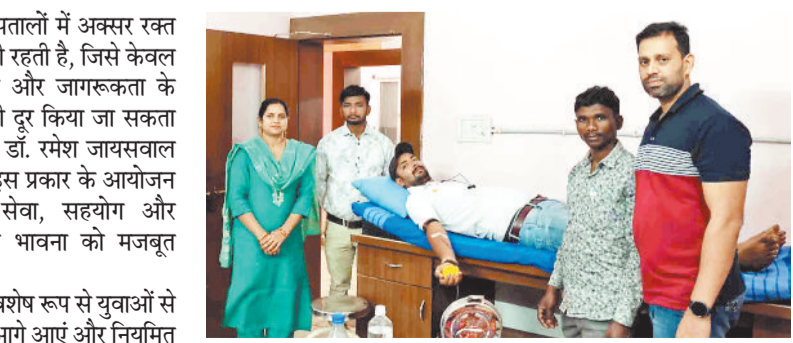
मानकों का पालन करते हुए सुरक्षित तरीके से रक्त संग्रहण किया गया। स्वास्थ्य विभाग की टीम द्वारा रक्तदान करने वाले सभी लोगों को प्रोत्साहित करते हुए प्रशस्ति पत्र भी प्रदान किए गए।