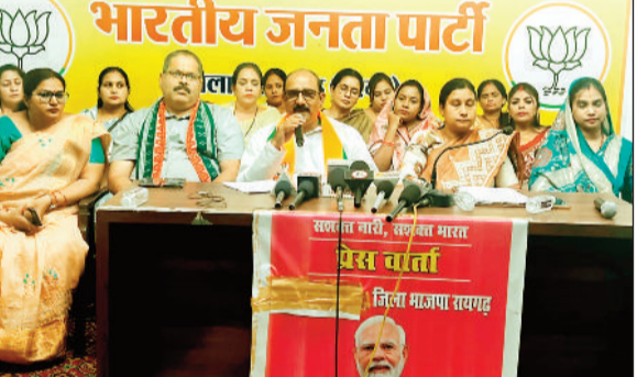
हरिभूमि न्यूज रायगढ़

भारतीय सभ्यता के हजारों सालों के इतिहास के साथ ही भारत लोकतंत्र की जन्मी है। भारत के पास इस सफर में एक नया पहलू जोड़ने का मौका था। हम देश की आधी आबादी को नीति-निर्धारण की प्रक्रिया में सक्रिय भागीदार बनाने के लिए यह नारी शक्ति वंदन अधिनियम लाए थे। सदन में विपक्ष द्वारा नारी शक्ति वंदन अधिनियम खारिज किए जाने