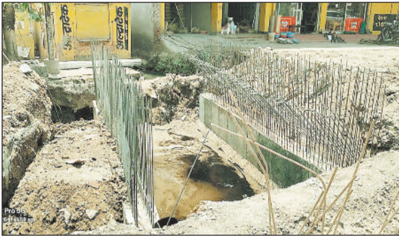
हरिभूमि न्यूज चंद्रपुर

रहा है। मोहल्लेवासियों का कहना है कि बरसात का मौसम नजदीक है, लेकिन जिम्मेदार विभाग और टेकेदार इस ओर गंभीर नजर नहीं आ रहे हैं। यदि समय रहते पुल का निर्माण पूरा नहीं किया गया, तो इस बार जलभराव की स्थिति और भी विकराल हो सकती है। हर साल बारिश में घरों में पानी घुसने की समस्या रहती है, लेकिन इस बार अधूरे निर्माण के कारण हालात और