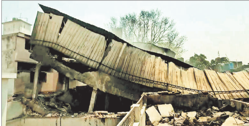
भीषण अग्नी काण्ड में जर्जर होकर धराशायी हुआ तीन मंजिला भवन।